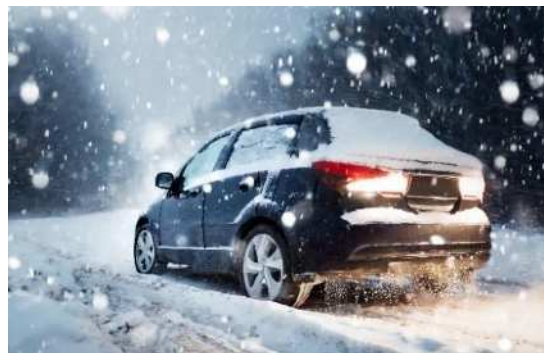
図1 立ち往生車両の冬タイヤ・チェーン装着状況

スリップ事故が多いのは交差点ですが、橋の上、トンネルの出入口付近、日陰で乾きにくい場所などは路面凍結に気が付かないことがあるので注意が必要です。