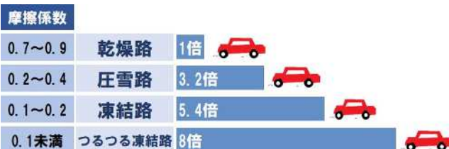
図2 路面状況による滑りやすさの比較

注)摩擦係数とは、タイヤと路面間の摩擦力の大きさを表す指数をいい、指数が小さいほど滑りやすいことを意味しています。