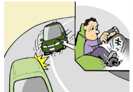
カーブでのスピード出しすぎ