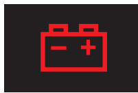
バッテリーランプ