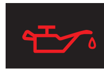
エンジンオイルランプ