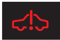
ハイブリッドシステム異常警告灯