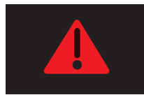
マスターウォーニング